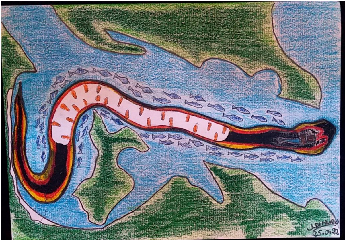
Figura 4- A partida do transporte de materialização