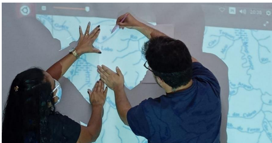
Figuras 2, 3 e 4 – Pesquisadores e suas atividades de mapeamento para o projeto